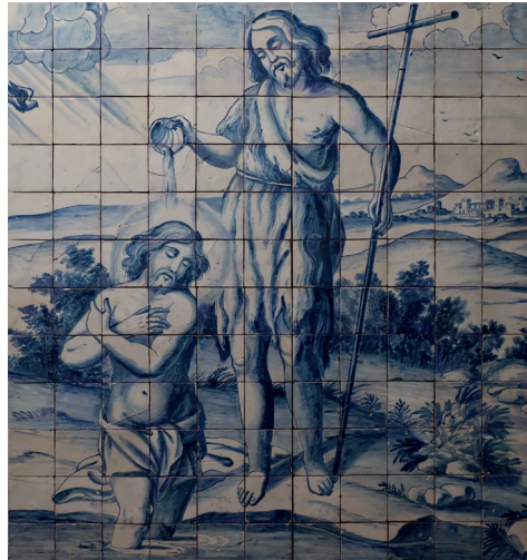
So hat sich ein portugiesischer Künstler die Taufe von Jesus vorgestellt und auf Kacheln gemalt.