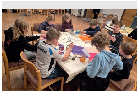
Hier basteln Konfi 3 – Kinder im Advent ein buntes Windlicht.

Wir laden die Eltern herzlich ein zu einem Informationsabend am Donnerstag, dem 21. Mai 2026, 19.00 Uhr im St.-Viti-Gemeindezentrum . An diesem Abend können Sie Ihre Kinder anmel-