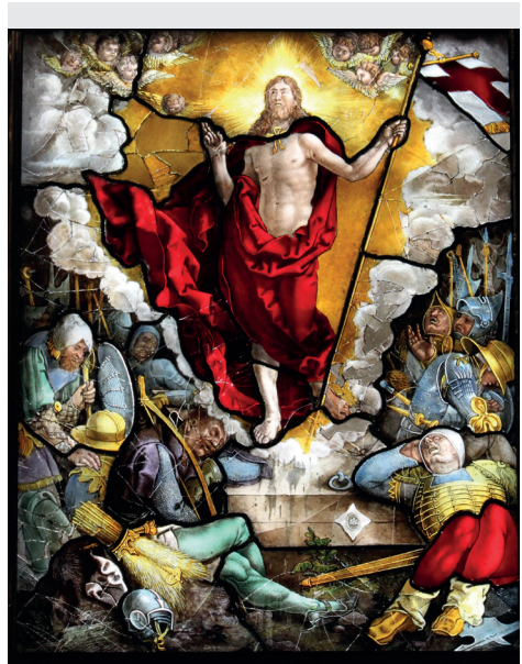
Als Jesus aufersteht, erstarren die Soldaten, die sein Grab bewachen sollen. Buntglasfenster im Freiburger Münster