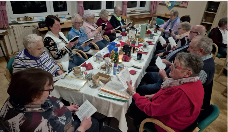
Gemeinsam singen gehört beim Gemeindetreffen dazu.