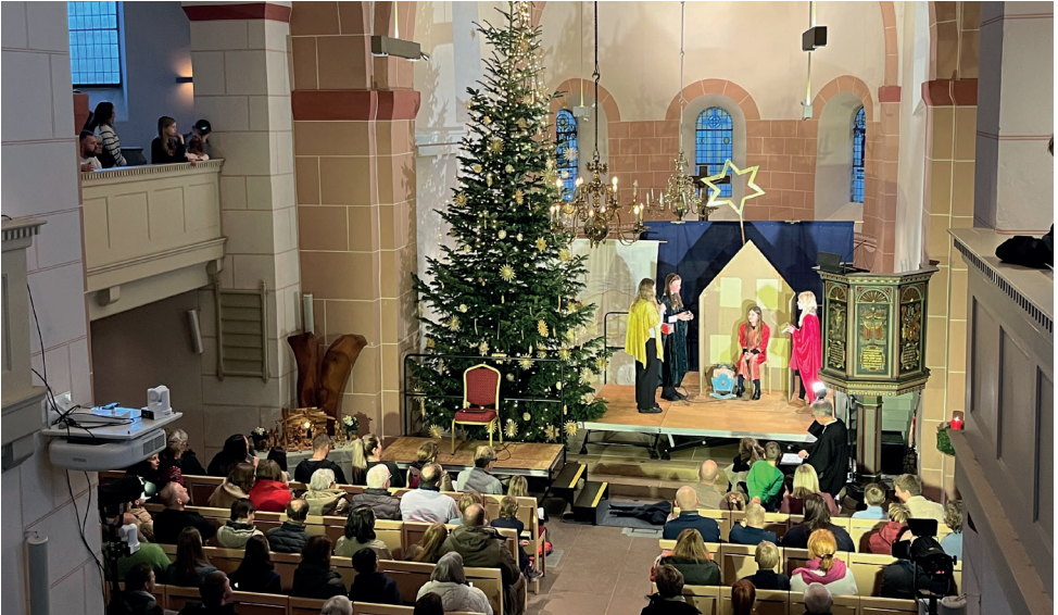
Krippenspiel-Gottesdienst am Heiligen Abend 2025 in einer vollbesetzten Kirche.