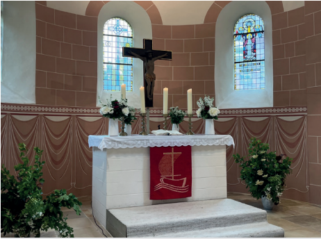
Der Altar zu Pfingsten

ben, und wird daher an allen anderen Tagen des Kirchenjahres verwendet, die aus den oben genannten Kategorien rausfallen. Manche Gemeinden verwenden auch Schwarz , bspw. Karfreitag, andere lassen den Altar an den Kartagen ungeschmückt, als Zeichen der Trauer. So ist am Altar der Kreislauf des Kirchenjahres und damit auch des Lebens sichtbar.