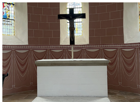
Karfreitag bleibt der Altar leer.

Weiß ist die Christusfarbe und wird zu allen Christus-Festen verwendet, besonders Weihnachten und Ostern. Violett steht für Buße, Umkehr und Vorbereitung und kommt im Advent und der Passionszeit zum Einsatz. Rot steht für den Heiligen Geiste und die Kirche, und findet darum zu Pfingsten, dem Reformationstag aber auch zu Konfirmationen Verwendung. Grün – die am häufigsten zu sehende Farbe am Altar – steht für Wachstum und Gedeihen, v.a. im Glau-