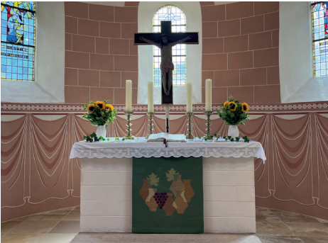
Altar der St.-Viti-Kirche