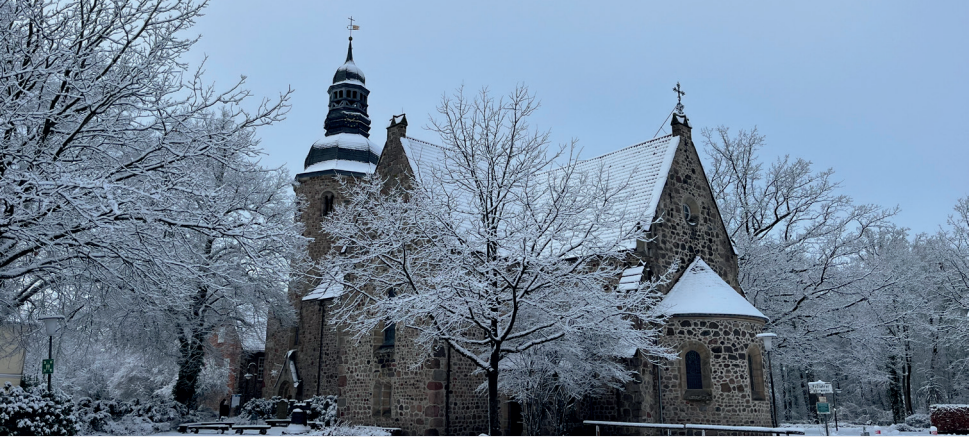
Die St.-Viti-Kirche im großzügigen Schnee des Januars 2026.