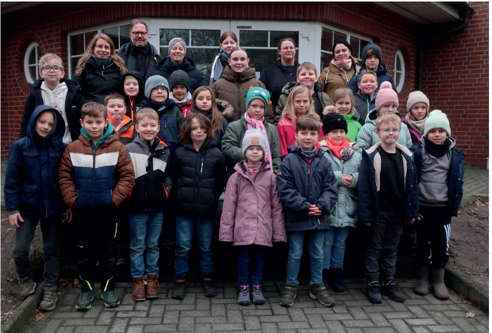
Die Konfi 3 – Kinder waren an einem Wochenende im Januar in der Freizeit- und Begegnungsstätte Oese. Auch drei Konfi 7 – Jugendliche nahmen teil und unterstützten die Erwachsenen bei der Betreuung der Kinder.