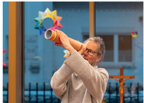
Neue Perspektiven bei der Abendandacht des Gemeindebeirates zur Jahreslosung 2026