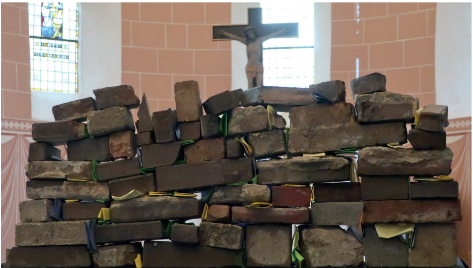
Die Konfi 3- Kinder beschäftigten sich am 8. November auf verschiedene Weise mit dem Thema „Beten“. Unter anderem bauten sie eine kleine Klagemauer, schrieben eigene Klage- und Bittgebete und steckten sie in die Ritzen der Mauer.