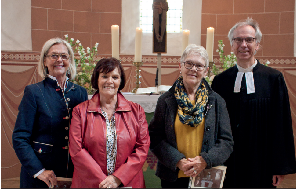
Diamantene Konfirmandinnen (60-jähriges Konfirmationsjubiläum)