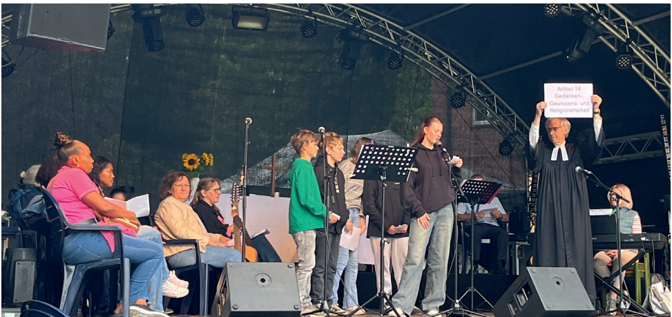
Beim Familien-Freiluft-Gottesdienst der Arbeitsgemeinschaft Christlicher Kirchen (ACK) am 21. September im Zevener Stadtpark standen die Rechte von Kindern im Zentrum. Die im November 1989 in der UN verabschiedeten Kinderrechte sollen Kindern weltweit Schutz und Sicherheit geben. Kinder und Jugendliche der Kirchengemeinden trugen diese Rechte vor.