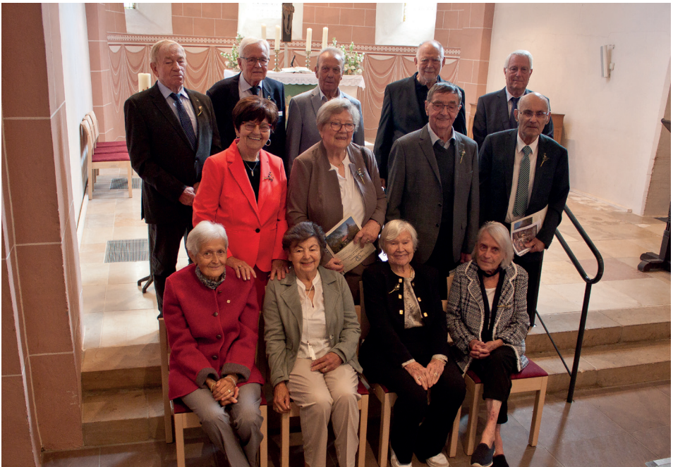
Gnadenkonfirmandinnen und -konfirmanden (70-jähriges Konfirmationsjubiläum)