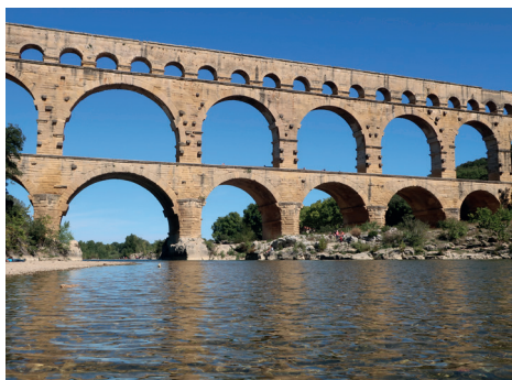
Meisterwerk römischer Bauingenieure: Pont du Gard