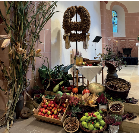
„Alle gute Gabe ...“: Wunderbar geschmückt wurde die Kirche zu Erntedank am 05.10. dieses Jahr von den Brüttendorfern! Herzlichen Dank!