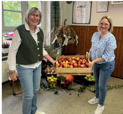
... und auch beim Seniorennachmittag in Brüttendorf am 10.10. wurden die Ernteerträge der heimischen Bäume bestaunt!