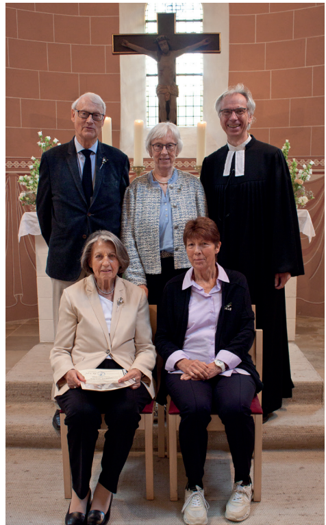
Eisernen Jubilarinnen (65-jähriges Konfirmationsjubiläum)

„ Herzliche Glück- und Segenswünsche allen Jubilarinnen und Jubilaren!