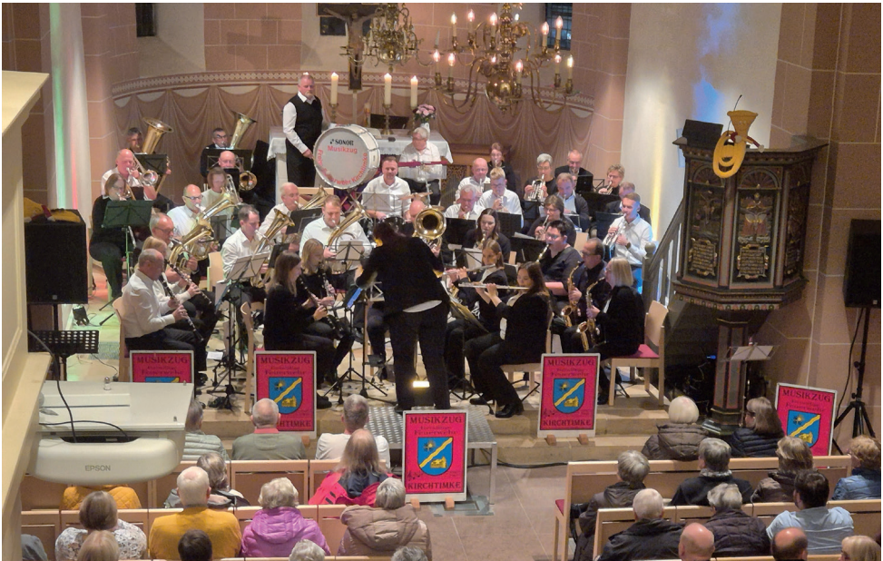
Die Kivinan-Stiftung organisierte am 8. November ein Konzert mit dem Musikzug Kirchtimke in der St.-Viti-Kirche. Das Publikum war begeistert vom bunten Programm u. a. aus böhmischer Blasmusik, einem Abba-Medley, „Sounds of Silence“ und dem Gospel „I will follow him“.