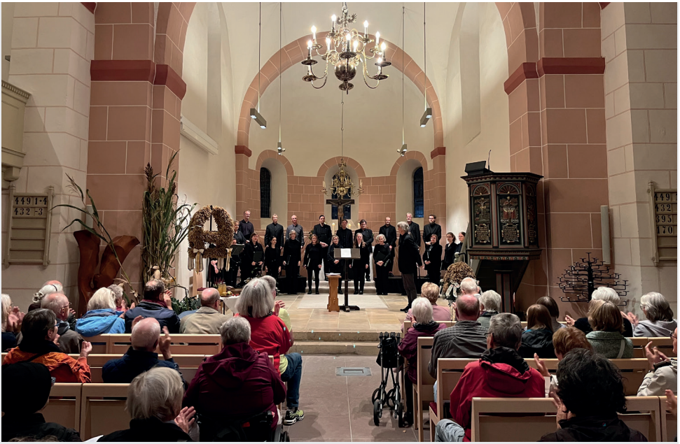
Ein volles Haus zum beeindruckenden Konzert des Kammerchores des Bremer Domchores am 05.10.! Zu Klängen verschiedener Musik aus der Romantik zum Thema „Sturm und Ruhe“ stimmen sich viele begeisterte Hörerinnen und Hörer auf den Herbst ein.