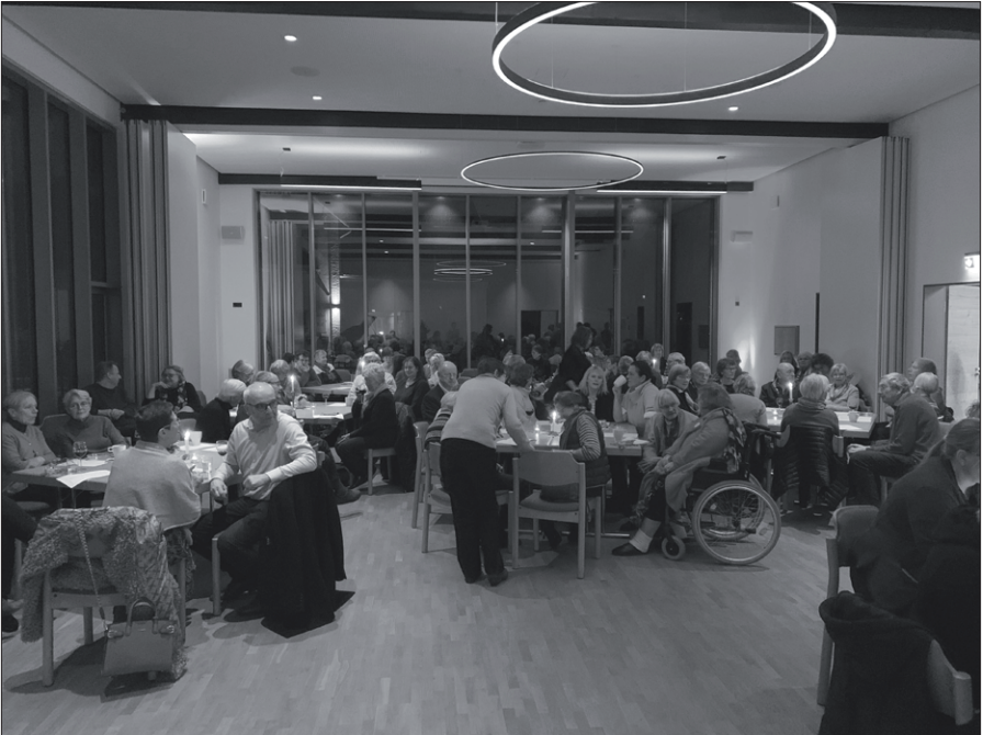
„Volles Haus“ beim Konzert am 5. März 2023

dann noch eine moderne Version von „Bewahre uns Gott, behüte uns Gott“. Ein rundum gelungener Abend, bei welchem der Künstler es insbesondere vermochte, die mitunter durchaus anspruchsvollen Stücke leichtgängig klingen zu lassen.