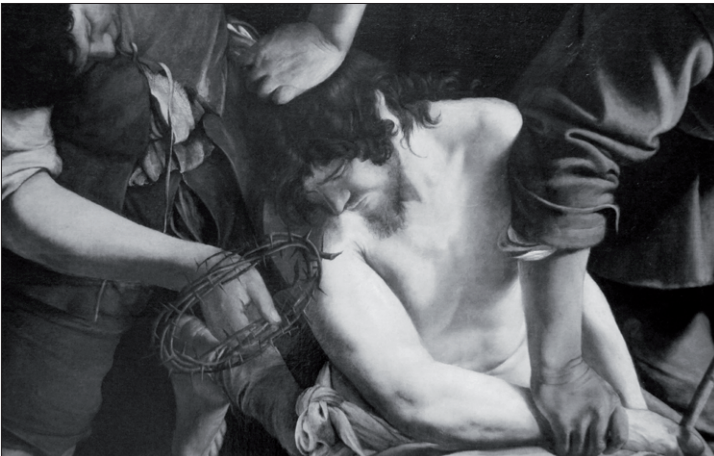
Christus erniedrigte sich selbst für uns – Gemälde eines Caravaggio-Schülers zur Verspottung Christi

Denn das ist doch gar nicht so einfach: mal nicht auf das Eigene zu sehen, auf das, was einem nützt, sondern von sich selbst abzusehen und sich dem zu widmen, was dem Nächsten nützt. Das zu können, setzt eine gewisse persönliche Reife voraus. Und es setzt voraus, keine Angst zu haben um sich selbst, keine Angst, zu kurz zu kommen.