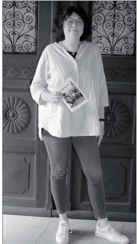
Zeven, 55 Jahre, verheiratet, zwei erwachsene Söhne

Bei normalen Anliegen wie beispielsweise Patenschein, Taufanmeldung