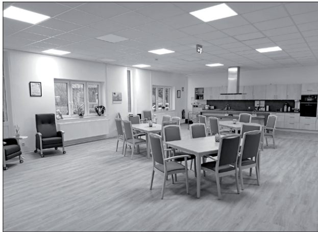
Die Räumlichkeiten der neuen Tagespflege: hier der Aufenthaltsraum

Seit Jahren schon betreibt die Diakoniestation des Ev.-luth. Kirchenkreises Bremervörde-Zeven eine Senioren-Tagespflege in der Alten Straße in Selsingen. Nun hat Anfang März die Diakonie im Gebäude nebenan eine zweite Tagespflege eröffnet. Es gibt in