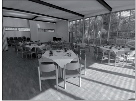
Der neue Saal mit gedeckten Tischen