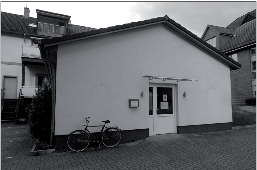
Das Kirchenbüro während der Bauphase des neuen Gemeindehauses