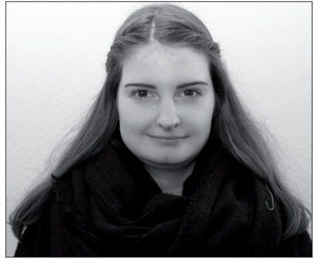
19 Jahre, evangelische Jugend Zeven

Hauptsächlich war ich in der Kinder- und Jugendarbeit tätig, beispielweise beim Konfirmandenunterricht des 3., 7. und 8. Schuljahres. Bei dem Konfirmandenunterricht der Drittklässler habe ich bei den Vorbereitungstreffen der Eltern teilgenommen und dann auch mit zwei Müttern eine Kleingruppe geleitet. Dieses Jahr habe ich auch die Konfirmandenfahrt nach Berensch bei Cuxhaven mit Planung von einzelnen Stationen inhaltlich mitgeplant. Natürlich habe ich dann auch als Mitarbeiterin bei der Konfirmandenfahrt mitgewirkt.