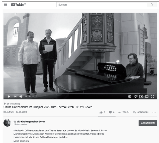
Online Gottesdienst auf YouTube

Auch wenn wir inzwischen wieder Gottesdienste in unserer Kirche feiern, bleibt dieses Angebot bis auf Weiteres