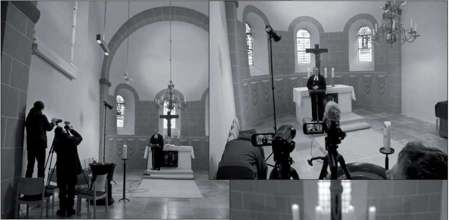
Die Kirche wird zum Filmstudio. So sieht es bei dem Dreh von Online-Gottesdiensten aus.