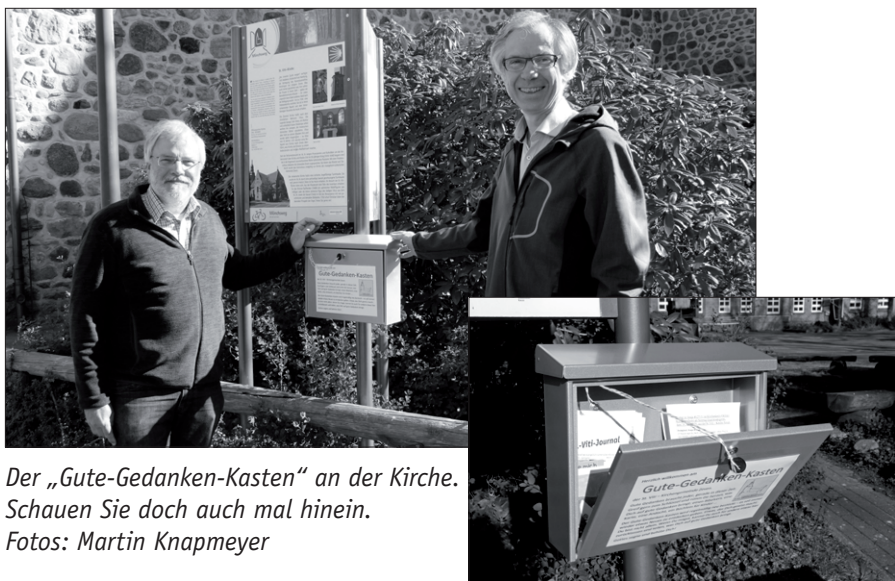
Der „Gute-Gedanken-Kasten“ an der Kirche. Schauen Sie doch auch mal hinein.