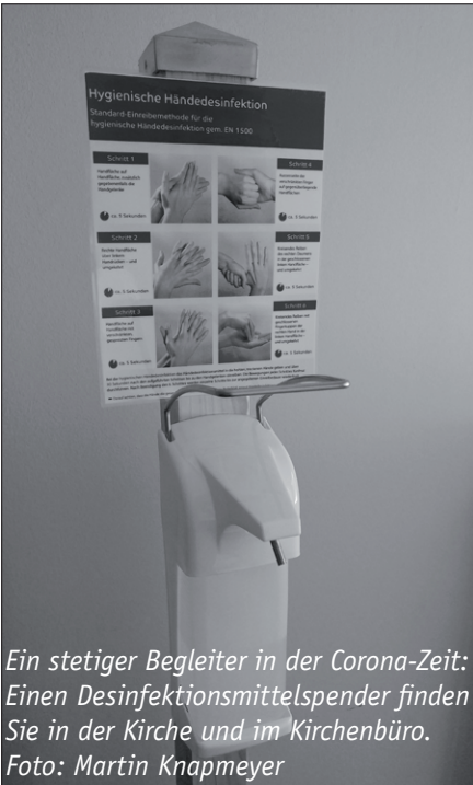
Ein stetiger Begleiter in der Corona-Zeit: Einen Desinfektionsmittelspender finden Sie in der Kirche und im Kirchenbüro.