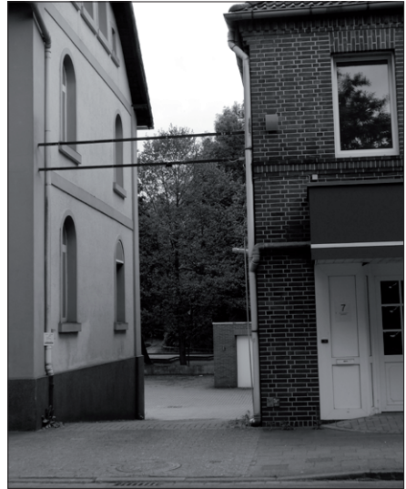
Durchgang von der Labesstraße