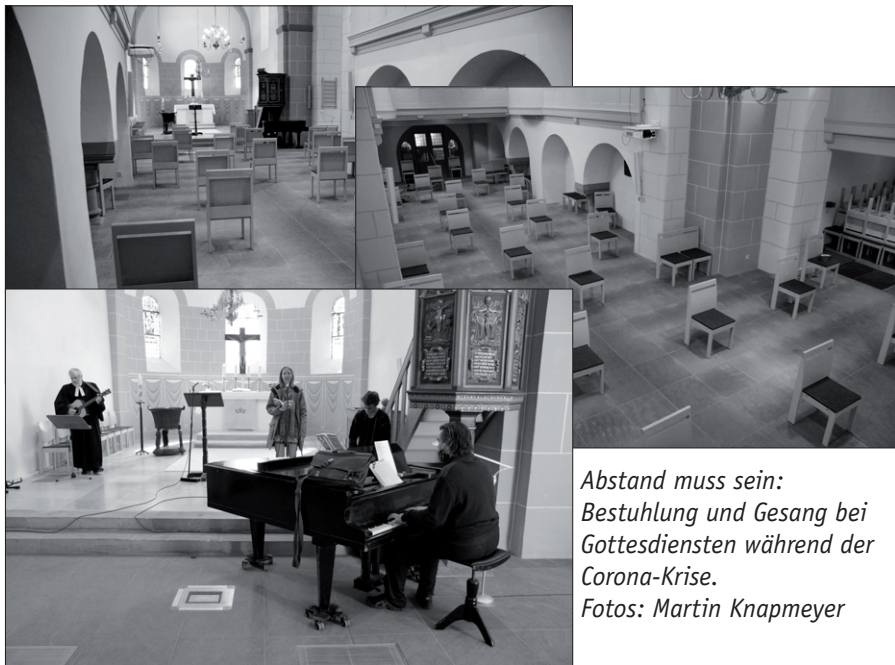
Abstand muss sein: Bestuhlung und Gesang bei Gottesdiensten während der Corona-Krise.