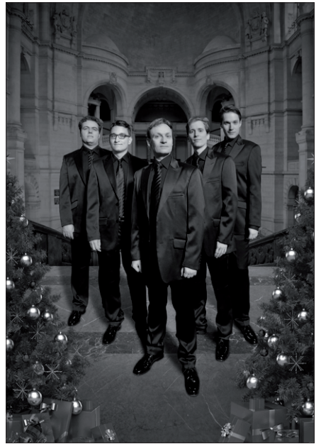
HANNOVER HARMONISTS kommen mit ihrem neuen Weihnachtsprogramm nach Zeven

Endlich, endlich ist es soweit: Die letzten Geschenkartikel aus der Bahnhofsdrogerie sind verteilt, die Krippenspiele haben ihren feierlichen Abschluss genommen. Höchste Zeit für eine musikalische post-krippale Feierstunde mit den Hannover Harmonists! Ein letztes „merry little christmas“, bevor die fünf Sänger