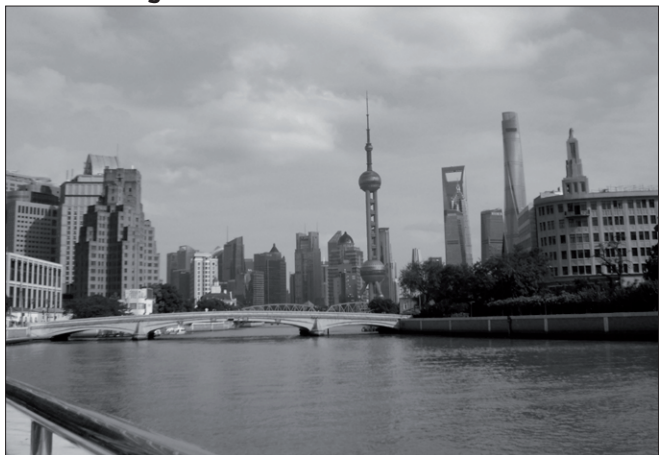
Stadtansicht aus Shanghai

Grete Hoops is en plattdüütsche Schrieversche. Se is 1935 as Dochter vun en Veehköper in Oostertimk boren. Nu leevt se in Tarms. – Aus ihren plattdeutschen Geschichten wird sie uns vorlesen.