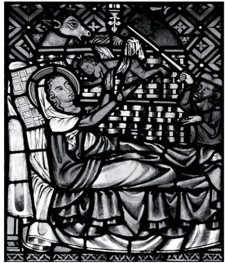
Freude über das neugeborene Kind – Krippendarstellung in einem Fenster des Freiburger Münsters

Wenn man die Fleischwerdung ernst nimmt, ist klar: Gott ist nicht „all-