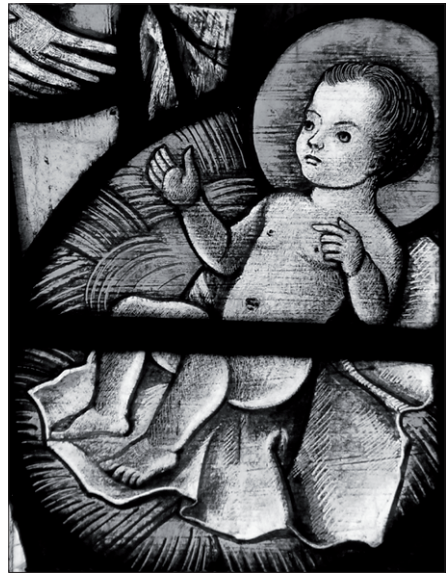
Das Jesuskind in der Krippe – Detail eines Buntglasfensters der St. Viti - Kirche