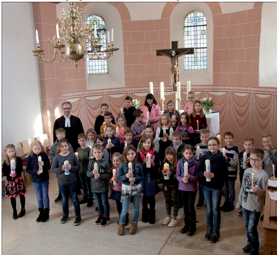
Täuflinge und Kinder mit Taufkerzen beim Konfi 3-Tauf- und Tauerinnerungsgottesdienst am 17.2.2019